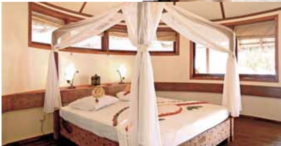
Camera Beach bungalow