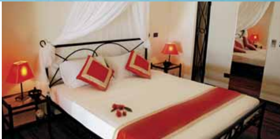
Camera beach bungalow

Windsurf, canoa, aqua-gym, stretching, beach-volley, ping pong, bocce, freccette. TV con collegamento via satellite e video. A pagamento: catamarano, snorkeling (noleggio attrezzatura e uscita in barca), diving center, noleggio delle imbarcazioni, escursioni alle isole vicine, piccolo centro benessere per massaggi svedese, thai, orientale e trattamenti di riflessologia plantare.