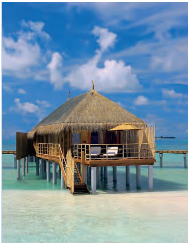
SENIOR WATER VILLA

Una piccola isola che concentra tutte le meraviglie delle Maldive: natura rigogliosa, spiagge bianche e mare ricco di vita. Resort completamente ristrutturato in grado di offrire ottimi servizi garantiti dal marchio Constance, tranquillità e relax.